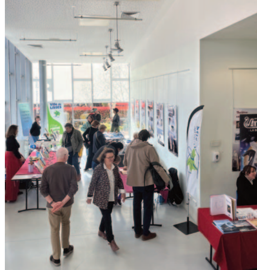
Le salon des autrices

La commune a récemment proposé plusieurs temps forts culturels qui ont rencontré un beau succès. L'exposition consacrée au théâtre a permis au public de redécouvrir cet art à travers photos et documents. Le salon des autrices a offert de riches échanges autour de la création littéraire féminine. Enfin, la visite de l'Opéra Garnier a émerveillé les participants, ravis de découvrir ce lieu emblématique.