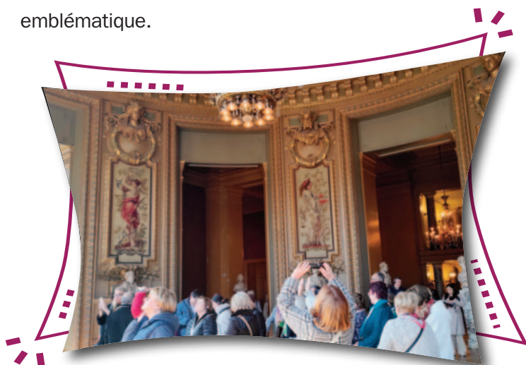
Visite de l'opéra Garnier