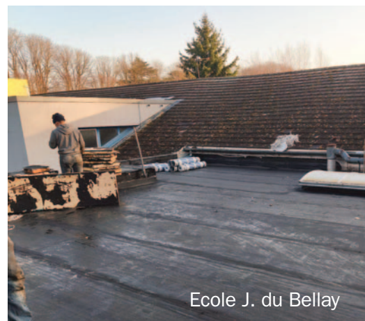
Ecole J. du Bellay

Ce procédé moderne présente de nombreux avantages, il permet une isolation plus performante, durable et mieux adaptée aux normes actuelles. À la clé, une toiture plus étanche, moins de frais d'entretien et un meilleur confort thermique pour les bâtiments scolaires.