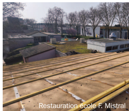
Restauration école F. Mistral