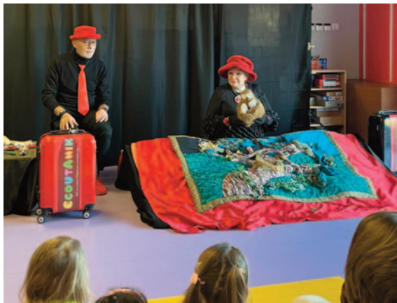
Raconte tapis avec Ecoutanik à la Maison de l'enfance

Les activités proposées aux tout-petits ont permis de capturer de jolis moments de découverte et de partage en famille.