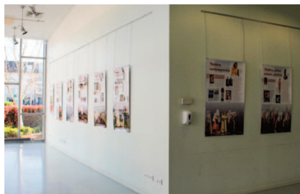
Exposition « un lieu, un art : le Théâtre »