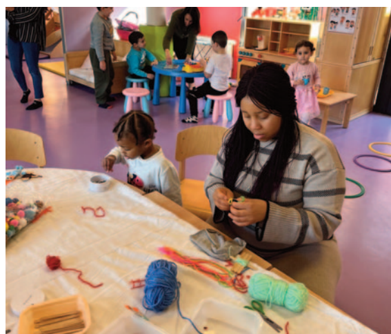
Si on jouait « l'hiver » à la ludothèque